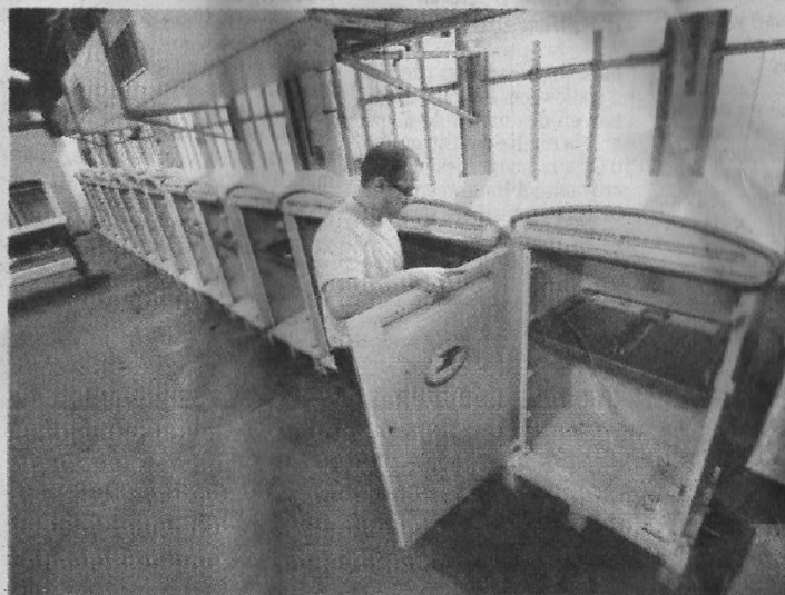
La Poste commande environ 1.500 boîtes par an.

Créée en 1929, d'abord spécialisée dans la fonderie de plomb, pour les scellés notamment, la fonderie Dejoie est passée à l'aluminium après la guerre, du fait de la pénurie. Et elle a obtenu en 1949 le marché des boîtes postales. Un marché prestigieux mais peu sujet au renouvellement. Depuis la guerre, l'institution