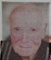
Georges Séguy Ancien secrétaire général de la CGT

L a médiatisation à propos de Thierry Lepaon n'est pas l'essentiel. Ce qui compte avant tout, c'est la crise qui s'est instaurée au sein même de la CGT. Il appartient aux organismes statutaires de la première centrale syndicale nationale d'en débattre franchement afin de rechercher une issue susceptible de préserver la cohésion de la CGT et son aptitude à poursuivre efficacement la lutte pour la défense des intérêts des travailleurs. J'ai la conviction que son comité confédéral national parviendra, dans l'esprit d'unité qui a toujours prévalu au sein de notre syndicalisme, à trouver la solution qui s'impose d'urgence. *