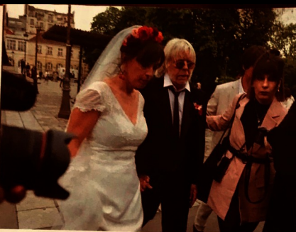
« Sa gonzesse » est devenu officiellement sa femme. Après la cérémonie civile à la mairie du XIV e , direction le temple protestant de Port-Royal.