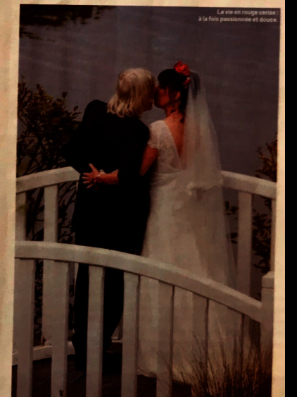
La vie en trois étages, comme à la fois passionnée et douce.

« Depuis la fin de sa tournée, Renaud s'emmerdait, estime cette vieille connaissance du chanteur. Il pensait qu'il ne pourrait plus